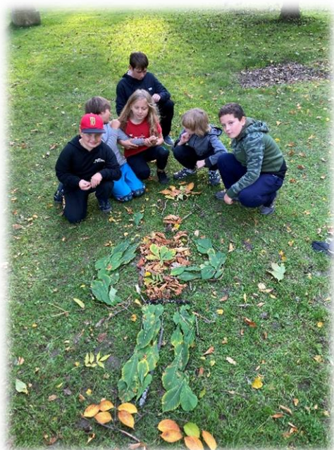
Oddíl Poutníci – obrázky z listí

Zázemí pro klubovnu nám poskytlo vedení střední školy v Kaplici - od ledna 2018 máme k dispozici učebnu v budově v Linecké ulici.