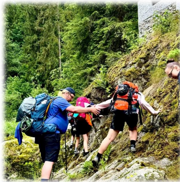
Cesta na hrad Pořešín