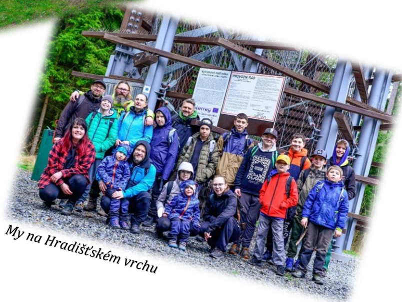
My na Hradištském vrchu