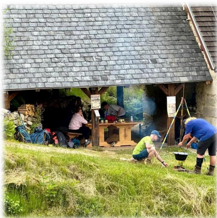
Večeře na hradě Pořešín