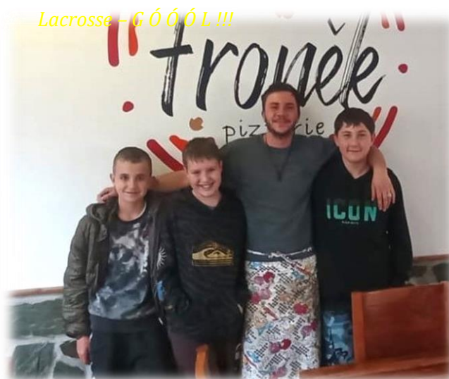
Oddíl Kadeti – Hrav ulicích města