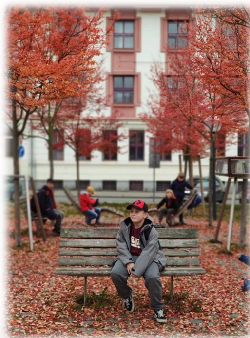
Na výletě v Táboře