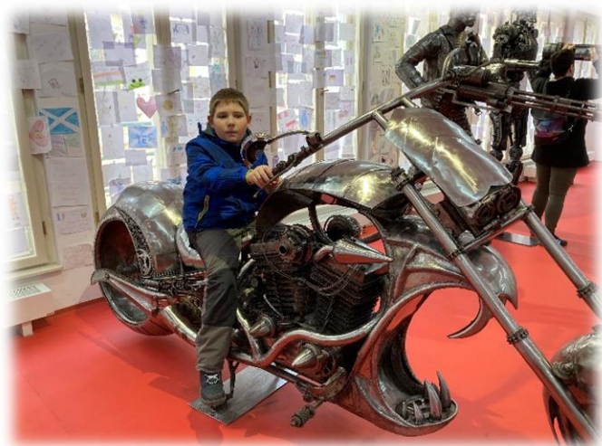
Muzeum ocelových figurín - Praha

... a nakonec ... samozřejmě nesměly chybět i nějaké ty nákupy. I přes to že nás na konci dne bolely nožičky, výlet jsme si užili.