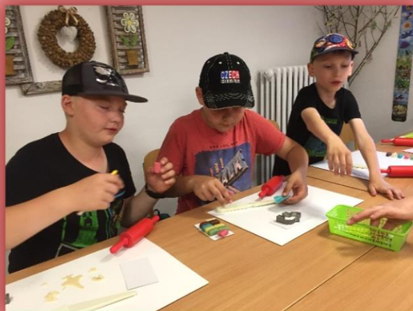
Muzeum marcipánu – v dílně