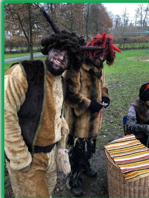
Hrátky s čerty