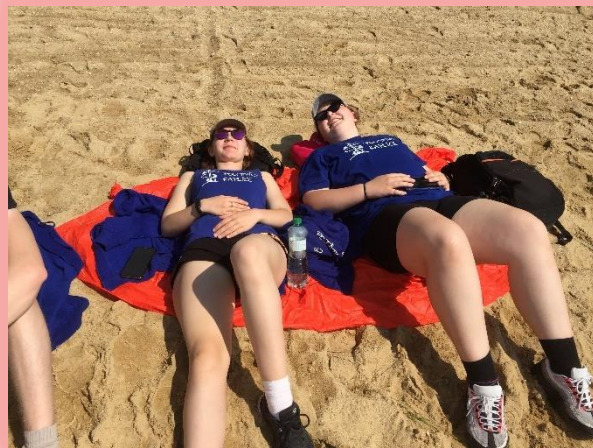
odpočinek u rybníka Svět