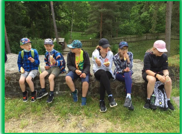
sobotní večeře v kempu – kotlíková gulášovka = krmení „dravé zvěře“ = svačinka na Hrádku Kozím