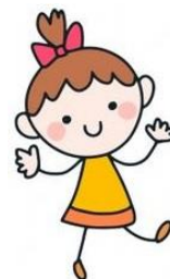
Lepíme lišky Bystroušky