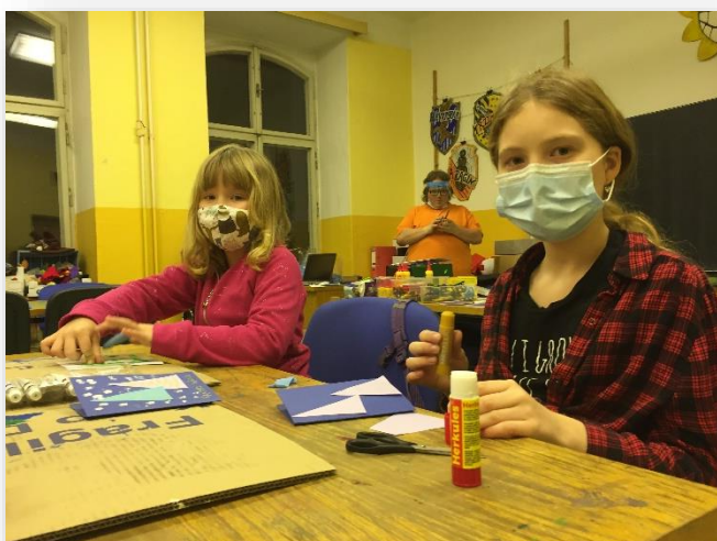
Vyrábíme vánoční přáníčka

Vánoční posezení u stromečku – s cukrovíčkem, čajem a vánočními koledami - bohužel tentokrát bez hudebního doprovodu skupiny Poprvé