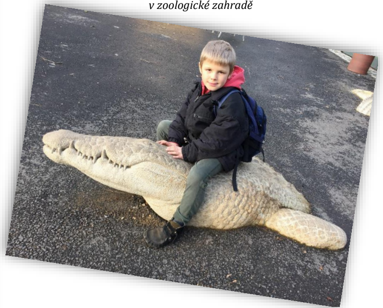
v zoologické zahradě

V neděli už nás čekala jen cesta domů. Do Plzně a zpátky jsme jeli vlakem, což byl pro mnoho dětí taky velký zážitek.