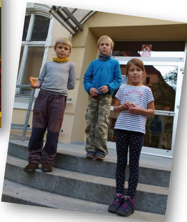
Vyhlášení výsledků atletické soutěže

S dětským oddílem trávíme čas buď v klubovně (učebna v budově SŠ) nebo venku. Pokud je to možné snažíme se chodit více ven do terénu nebo využíváme různá místa v Kaplici (hřiště u ZŠ, park, Suchý vrch, hry v ulicích města).