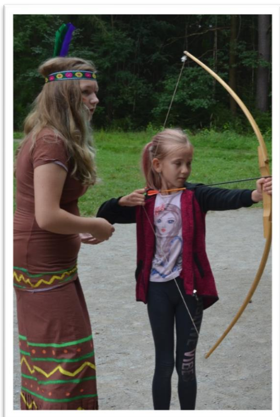
střelba z luku