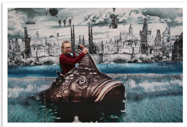
Muzeum Karla Zemana

Ubytování : v ZŠ Doprava : vlakem Stravování : sobotní oběd – v restauraci jinak z vlastních zdrojů