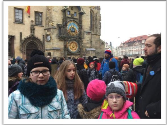
na Staromáku 😊