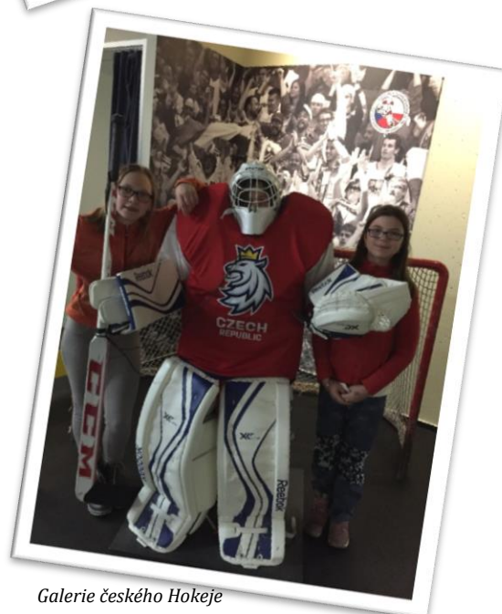
Galerie českého Hokeje