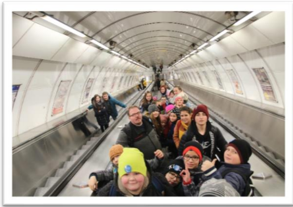
v metru 😊