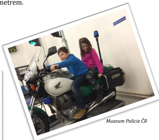
Muzeum Policie ČR