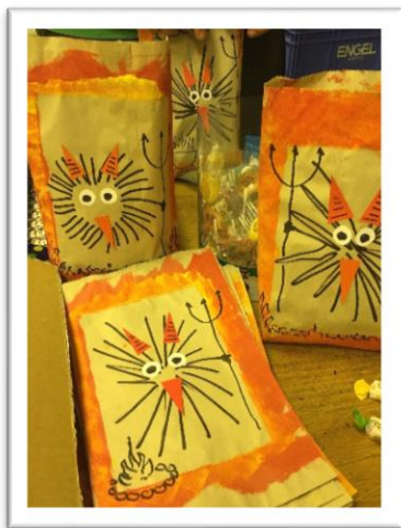
Kadeti připravili akci Hrátky s čerty. Vyrobili i sáčky na odměny

Zázemí pro klubovnu nám poskytlo vedení střední školy v Kaplici od ledna 2018 učebnu v budově gymnázia. Máme k dispozici i prostory pro sklad materiálu.