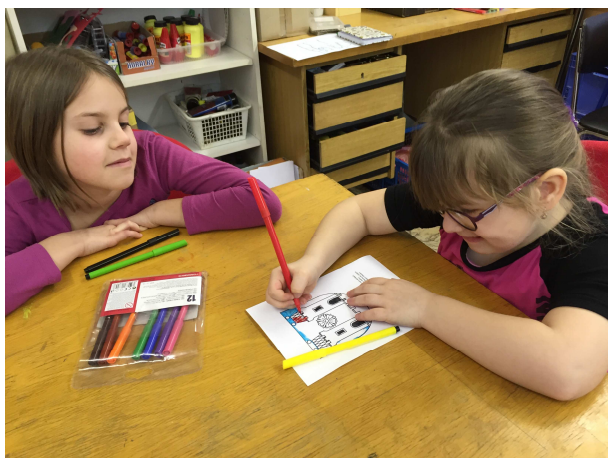
„Poznej své město“

jiné jednoduché práce. Z dotačního programu Jihočeského kraje jsme na podzim 2015 zakoupili elektrickou troubu s vařičem, takže se můžeme směle vrhnout i na teplou kuchyni :-). Velký úspěch měly u dětí šišky s mákem. Před vánoci jsme si upekli vanilkové rohlíčky a skořicové pracny.